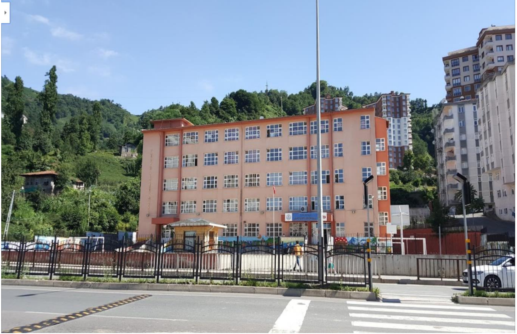
RİZE MERKEZ VAKIFLAR İLKOKULU